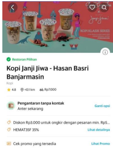
Gambar 3 Kopi Janji Jiwa Jilid 264 Via Grabfood