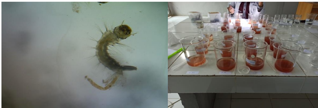
Gambar 2. Kondisi gelas uji perlakuan ekstrak kayu manis dan salah satu larva Aedes aegypti yang telah mati.

perbandingan kondisi larva Aedes aegypti sebelum dan sesudah diberi perlakuan. Ekstrak kayumanis memberikan efek larvasida yang menyebabkan kematian pada larva uji dengan ciri-ciri adanya kerusakan secara morfologis