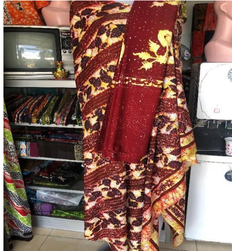
Motif khas Batik Tatzaka

menjadikan wadah untuk Bapak Edy melakukan kreativitas dan inovasi motif. Untuk mesiasati agar menarik dimata pengunjung event, beliau mengkombinasikan tema yang sudah ditentukan pemerintah. Dengan melihat warna yang sedang trend dikombinasikan dengan pengembangan motif asli Banyuwangi dan motif yang diciptakan oleh Bapak Edy sendiri. Bentuk inovasi dan kreatifitas Batik Tatzaka dalam hal motif, mereka menciptakan motif khas sendiri yang membedakan batik Tatzaka dengan batik lainnya.