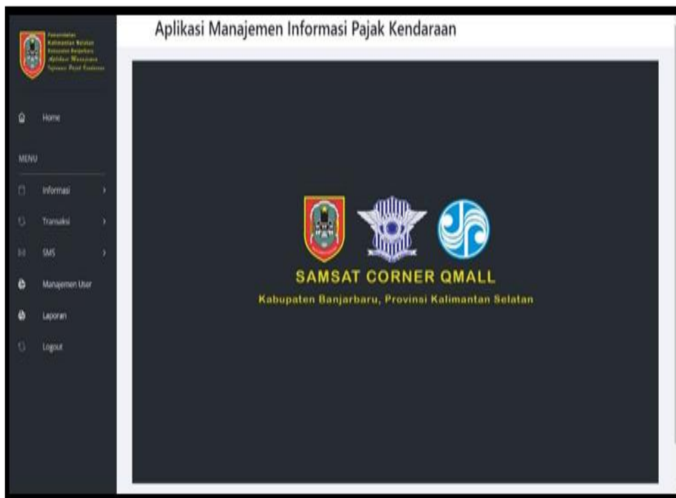
Gambar 1. 2 Halaman Menu Utama Admin

Setelah user memasukkan akunnya dengan benar dengan memasukkan akun admin maka halaman inilah nanti user akan dilahirkan dengan menyesuaikan akun, akun yang ia masukkan dengan benar.