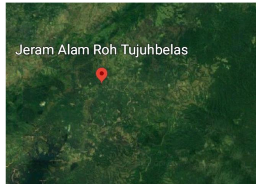
Gambar 3.1 Peta Lokasi Proyek Jembatan Sungai Berangas

Lokasi pekerjaan adalah data teknis dari proyek pembangunan jembatan girder baja komposit kelas A pada sungai kusan Kecamatan Aranio Kabupaten Banjar