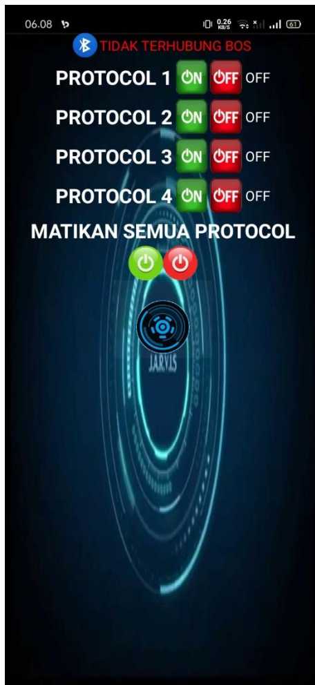
Gambar 3. Kontrol Protokol dari Aplikasi Android