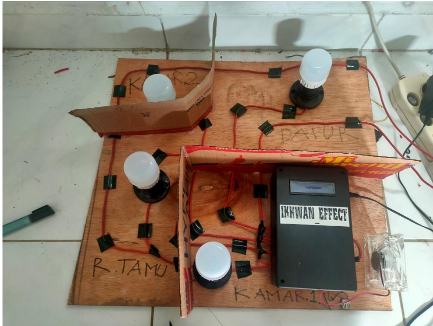
Gambar 1. Tampilan Dari Atas Rancang Bangun Mini Smarhome Dengan Speech Recognition Melalui Bluetooth Berbasis Android Menggunakan Arduino Uno.