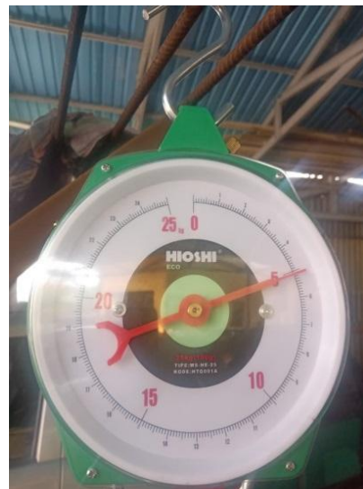
Gambar Hasil Peleburan dan Berat Hasil Peleburan

Pengujian alat dilakukan dengan proses peleburan sampah plastik dengan campuran oli bekas, pengujian dilakukan untuk mengetahui apakah alat dapat berfungsi sesuai dengan tujuan yang diinginkan yaitu dapat memproses peleburan sampah plastik dengan kostan, pengujian dilakukan untuk mengetahui seberapa efektif mesin pelebur sampah plastik tersebut. Pengujian dilakukan dengan proses peleburan sampah plastik dengan campuran oli bekas.