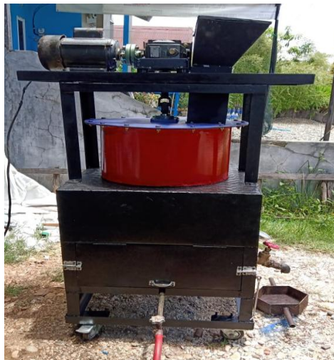
Gambar Mesin Pelebur Plastik

Dapat mempelajari data dan informasi yang lebih rinci mengenai proses mendaur ulang sampah plastik memakai mesin pelebur sampah plastik dengan motor listrik sebagai penggerak poros pengaduk, maka berbagai upaya dilakukan agar alat tersebut mempunyai cara kerja yang optimal. Selain itu untuk mengidentifikasi mesin tersebut yang efektif guna peningkatan efisiensi biaya dan energi pada peralatan yang digunakan. Untuk itu diperlukan analisa hasil alat dan pengujian yang lebih banyak.