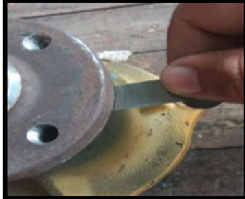
Gambar 4.2 Pengukuran Jarak Ruang Flange dan Housing