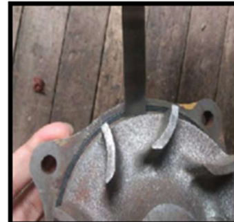
Gambar 4.1 Pengukuran jarak ruangan Impeller dan Housing )